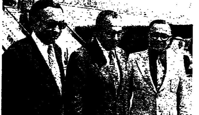
السيد كمال أبو الجعد وزير الاعلام المصري لدى وصوله الى المطار وفي استقباله وزير الاعلام السيد محمود عمار، والسيد رفيق المجرور مدير متولي

السيد كمال أبو الجعد وزير الاعلام المصري... (Detailed report on the Egyptian delegation's arrival and the meeting with the Lebanese Minister of Information.)